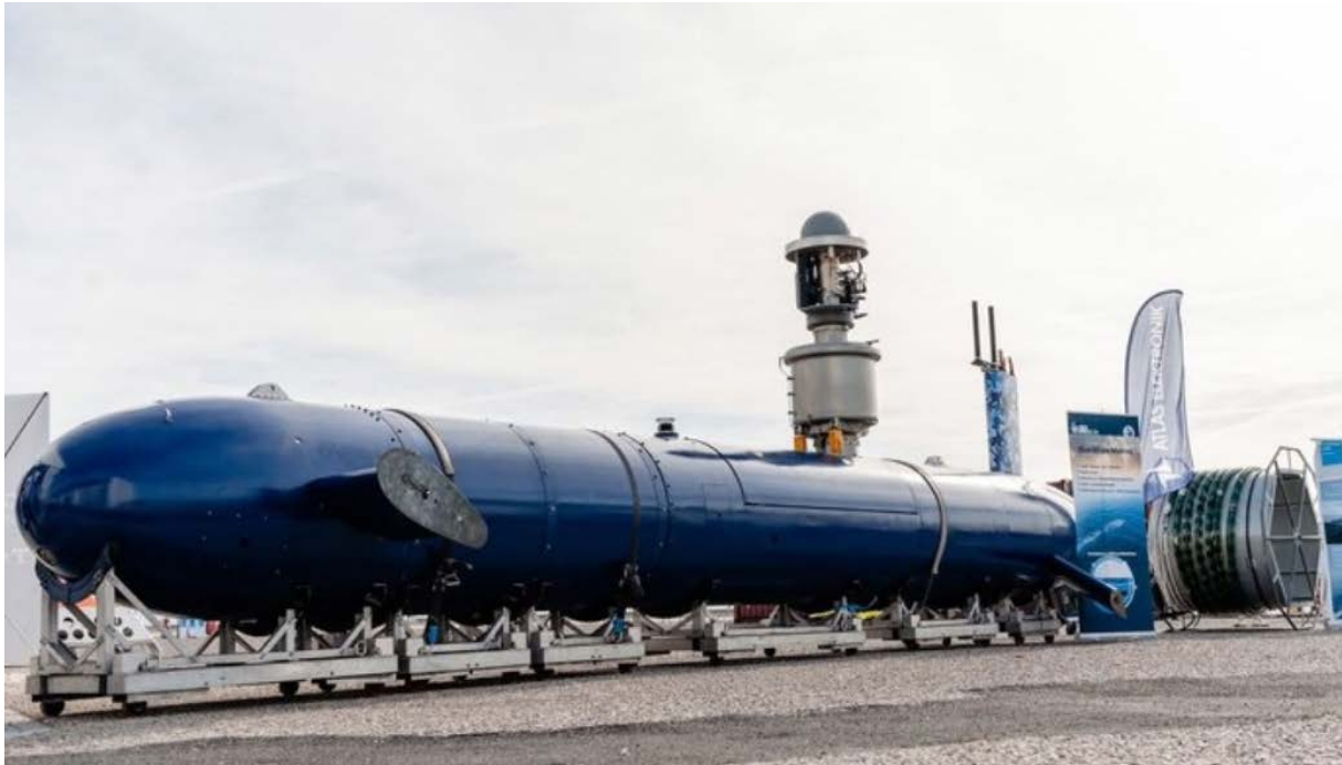
Foto de el submarino no tripulado israelí BlueWhale.

Entre las principales tendencias a destacar se encuentran el aumento del gasto militar en la región, la preeminencia del ámbito naval que se ve reflejado en los últimos desarrollos e inversiones y el uso militar de nuevas tecnologías como la Inteligencia Artificial.